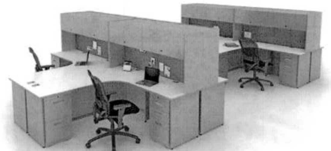
IMAGEN DE LA PARTIDA 9 y 10 DEL PAQUETE CINCO